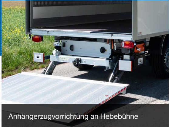
Anhängierzugvorrichtung an Hebebühne